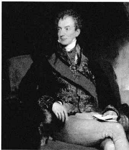
Portret al lui Klemens Wenzel von Metternich de Thomas Lawrence

lui a devenit realitate: „Când Parisul strănută, Europa răcește”, iar revoluțiile care au început în capitala franceză au ajuns în inima Imperiului Austriac. Metternich a fost nevoit atunci să fugă din Viena deghizat, în timp ce forțele liberale din stradă îi cereau demisia.