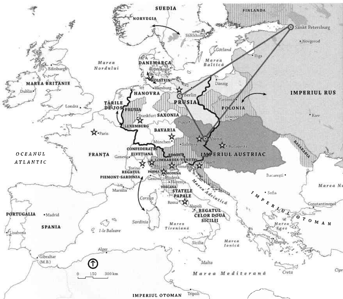
Hartă a Europei după Congresul de la Viena. Literele majuscule indică marile puteri ale vremii.

industriale din lume, a cărei expansiune a comerțului și a investițiilor necesita o putere navală incontestabilă. Între timp, pe continent, cancelarul Metternich a susținut puterile vechilor regimuri